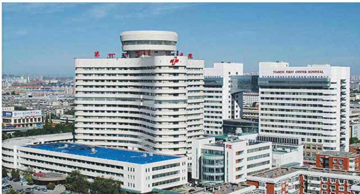
17-этажное здание Восточного центра трансплантологии при Первом центральном госпитале города Тяньцзинь на 500 коек, открытое в 2006 году

Всего несколько клиник уже осуществляют число операций, сопоставимое с официальной цифрой – 10 000. Однако даже это далеко от истинной картины. Более 1 000 клиник в 2007 году подали заявку на продление разрешения на проведение операций по пересадке органов. Это позволяет предположить, что они также соответствуют минимальным требованиям Министерства здравоохранения к центрам трансплантации. Многие из этих клиник продолжили свою деятельность несмотря на отсутствие разрешения.