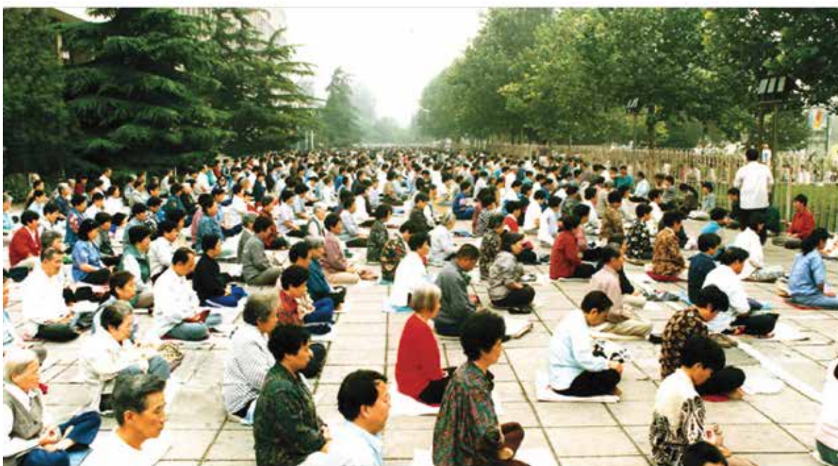
Занятия Фалуньгун в районе станции Мусиди в Пекине до начала преследования в 1999 году

Фалуньгун представляет собой медитативную практику, в основе которой лежат древние китайские традиции оздоровления организма и самосовершенствования, а также принципы истины, доброты и терпения. К концу 90-х годов по подсчётам китайского правительства, Фалуньгун занимались 70 миллионов человек. Эту цифру также цитируют некоторые западные СМИ.