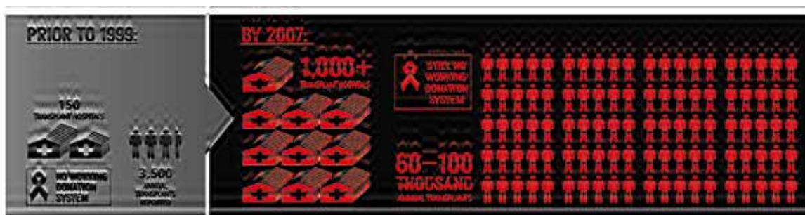
Взрывной рост индустрии пересадки органов в Китае после 1999 года

До 1999 года на территории материкового Китая существовало 150 клиник, занимавшихся трансплантацией. В 2007 году более 1 000 клиник обратилось в Министерство здравоохранения за продлением разрешения на проведение операций по пересадке органов. Возможность быстрого получения трансплантатов, большинство которых использовалось для местного населения, а также на фоне бума туристов, приезжающих из других стран для проведения операций, сделали Китай глобальным центром для тех, кто нуждался в жизненно важных органах.